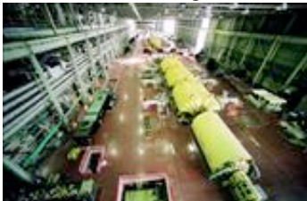
Bruce A turbine hall

Une étude sur l'étendue de la situation a également été entreprise. Elle comprend des tests de dépistage auprès de travailleurs qui ont œuvré dans d'autres secteurs du projet où le rayonnement alpha aurait pu être présent. Le 13 avril, des représentants de l'Institut de radioprotection du Canada ont rencontré ces travailleurs. La RSIC agit en tant que ressource de communications indépendante à la demande de Bruce Power et du Building Trades Council of Ontario.